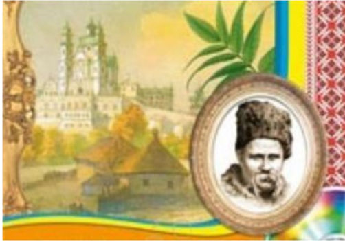
Міжнародний мовно-літературний конкурс учнівської і студентської молоді імені Тараса Шевченка

24 листопада 2018 року до Розсошенської гімназії завітали справжні шанувальники творчості світоча української літератури Т. Г. Шевченка. Тут відбувся II етап IX Міжнародного мовно-літературного конкурсу учнівської та студентської молоді імені Тараса Шевченка.